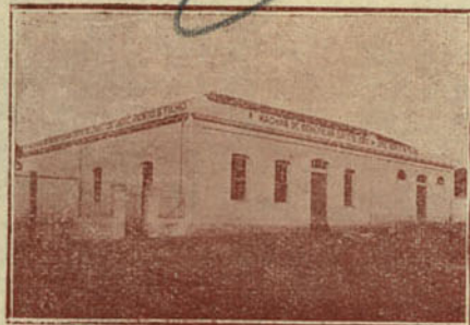
Installação completa, machinismos aperfeçoados e movidos a electricidade.