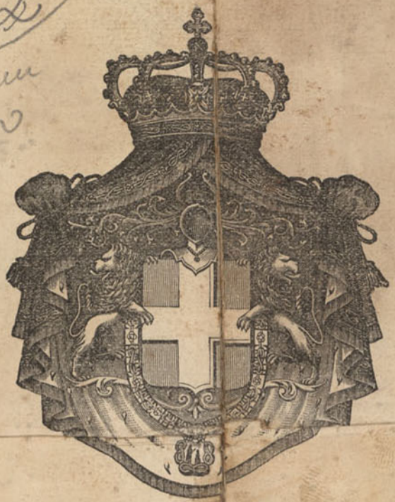
EXHIBIT 20 ABR 8 1917 ESTADANOS

SANTOS 8 - ABR 1917 Inspeccion de Inmigracion