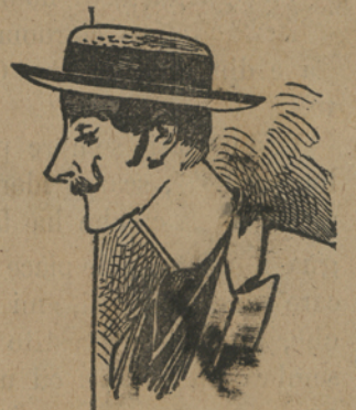
Figuri e Figurine