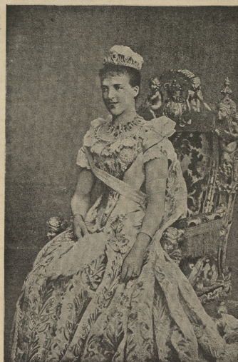
S. M. A RAINHA D. AMELIA