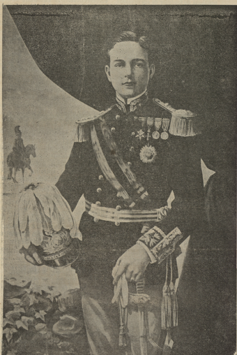
S. M. EL-REI D. MANOEL II