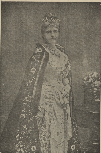
S. M. A RAINHA D. MARIA PIA