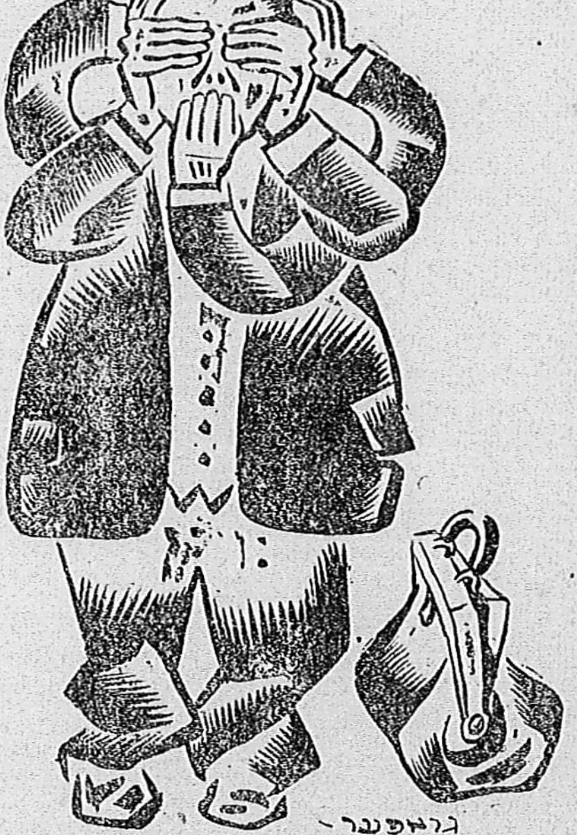
LA SITUAZIONE DEL CITTADINO IN ITALIA: NON PARLARE; NON UDIRE E NON VEDERE