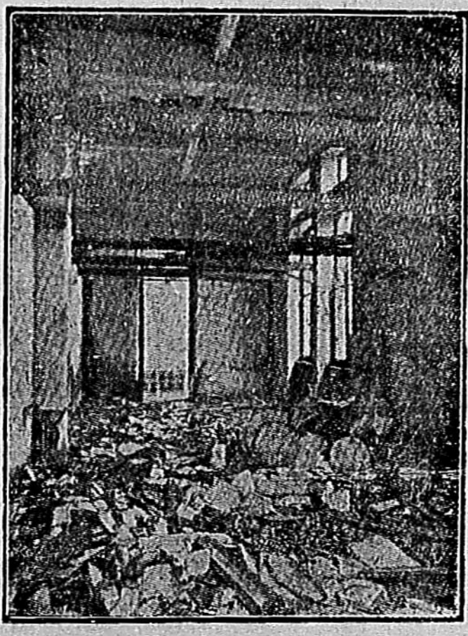
I locali dell'Alleanza Cooperativa di Torino dopo l'assalto delle camicie nere