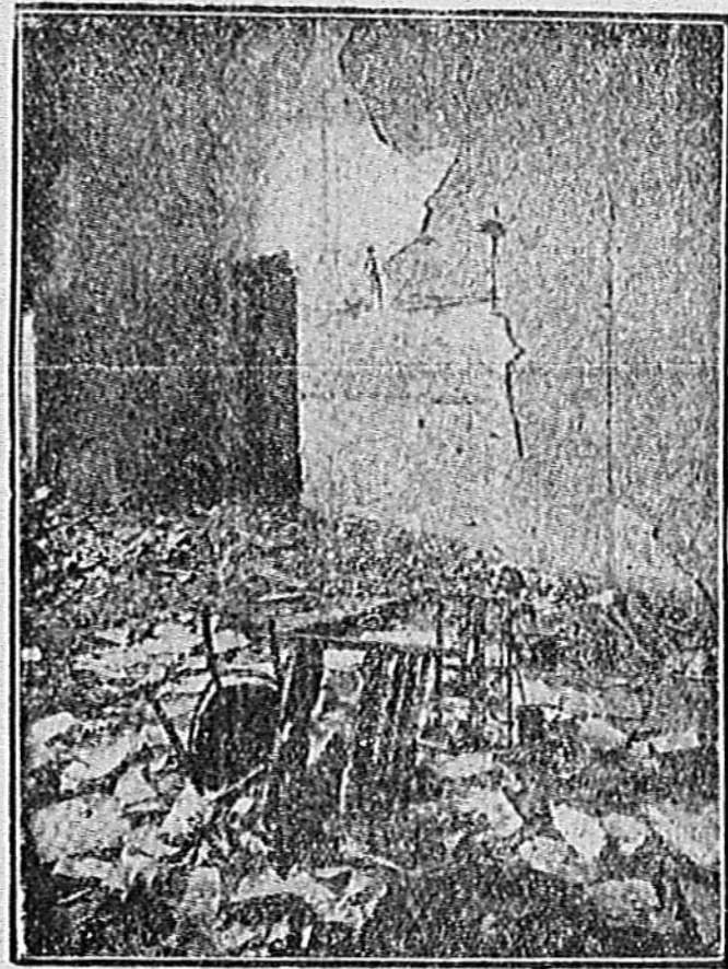
I locali dell'Alleanza Cooperativa di Torino dopo l'assalto delle camicie nere