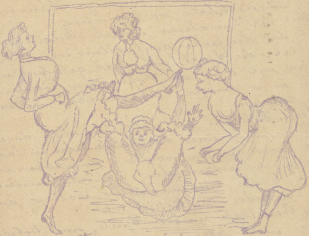
Parache im Goal bei einem Schlag

INSTITUTO HISTORICO E GEOGRAFICO DE SÃO PAULO