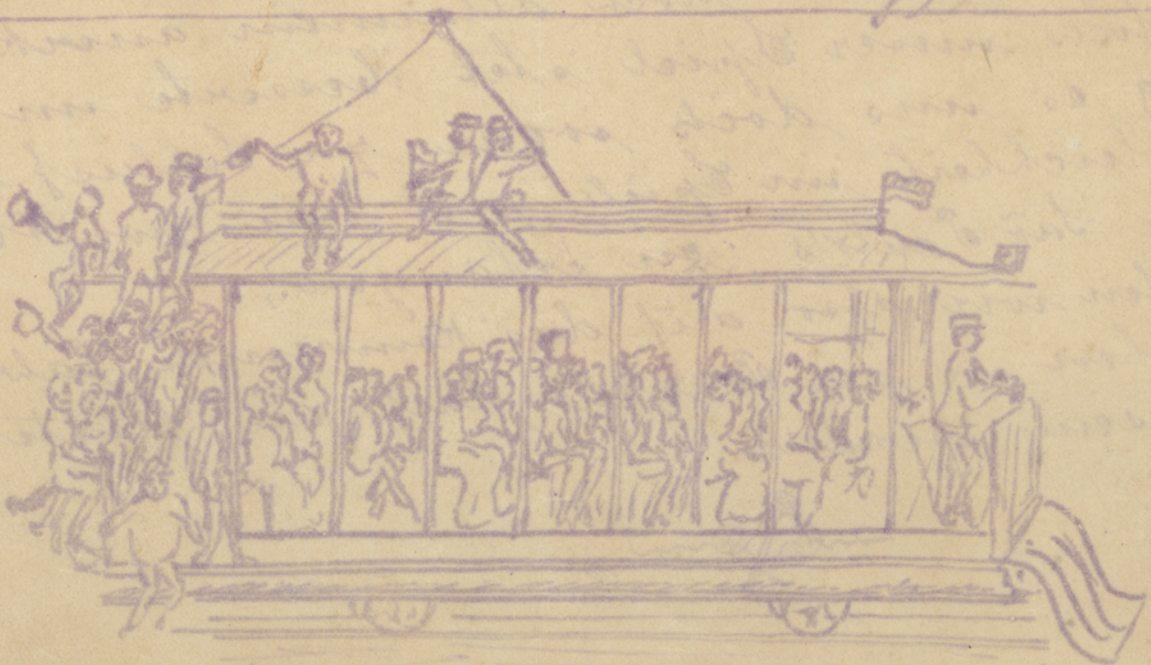
Wenckher von Agua Branca!!!